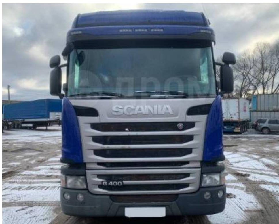
Scania 400 LA 4x2 MNA/HNA, модель 2014 г.в.

ТРАНСПОРТНЫЕ СРЕДСТВА. ПРЕДСТАВЛЕНЫ ФОТОГРАФИИ АНАЛОГОВ ИЗ ОТКРЫТЫХ ИСТОЧНИКОВ