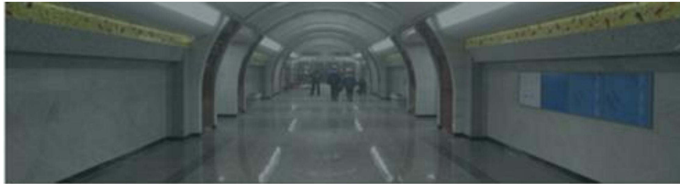
СТАНЦИИ «МЕЖДУНАРОДНАЯ» и «БУХАРЕСТСКАЯ»

В НАСТОЯЩЕЕ ВРЕМЯ РЕАЛИЗУЕТСЯ 13 КРУПНЫХ ПРОЕКТОВ, ИЗ НИХ 8 ПО СТРОИТЕЛЬСТВУ И РЕКОНСТРУКЦИИ СТАНЦИЙ МЕТРОПОЛИТЕНА И 5 ПРОЕКТОВ В ДРУГИХ ОБЛАСТЯХ СТРОИТЕЛЬСТВА, В ТОМ ЧИСЛЕ