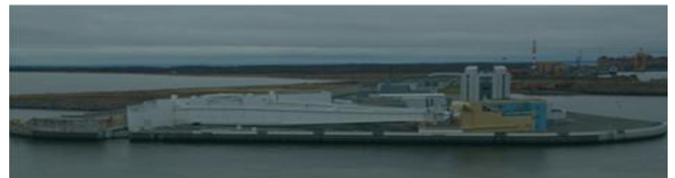
КОМПЛЕКС ЗАЩИТНЫХ СООРУЖЕНИЙ В ФИНСКОМ ЗАЛИВЕ