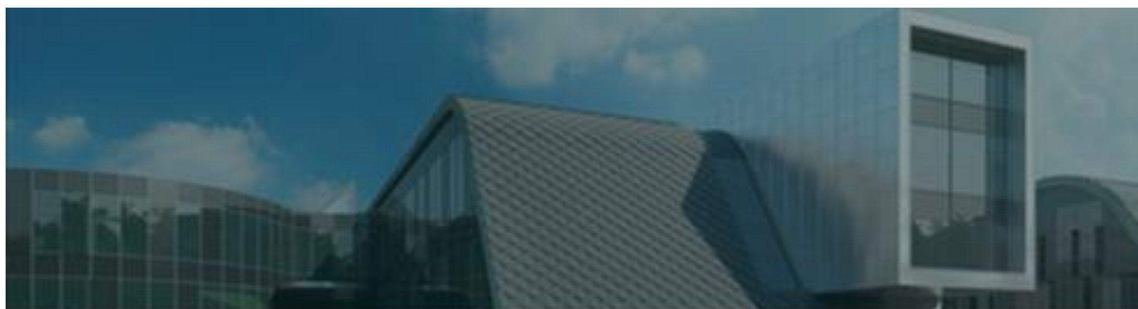
МНОГОФУНКЦИОНАЛЬНЫЙ МУЗЕЙНЫЙ ЦЕНТР В РОЖДЕСТВЕНО