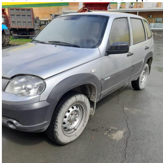
ФОТО ТРАНСПОРТНОГО СРЕДСТВА: