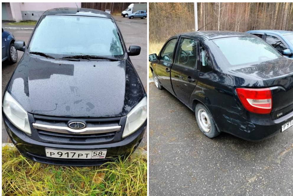
ФОТО ТРАНСПОРТНОГО СРЕДСТВА:

Оценка транспортного средства, принадлежащего должнику, произведена финансовым управляющим основываясь на анализе информации о ценовых предложениях аналогичных объектов движимого имущества в открытом доступе в сети Интернет на сайтах https://www.avito.ru .