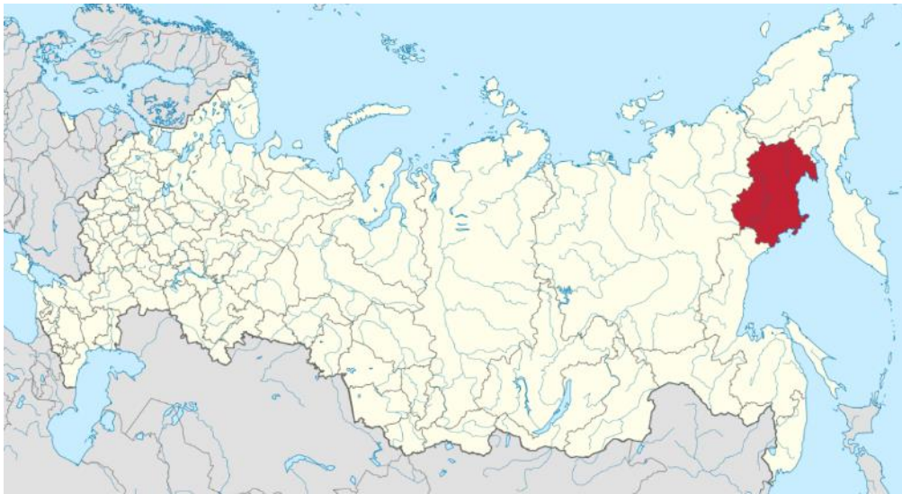
Рисунок 1. – Расположение Магаданской области на карте Российской Федерации